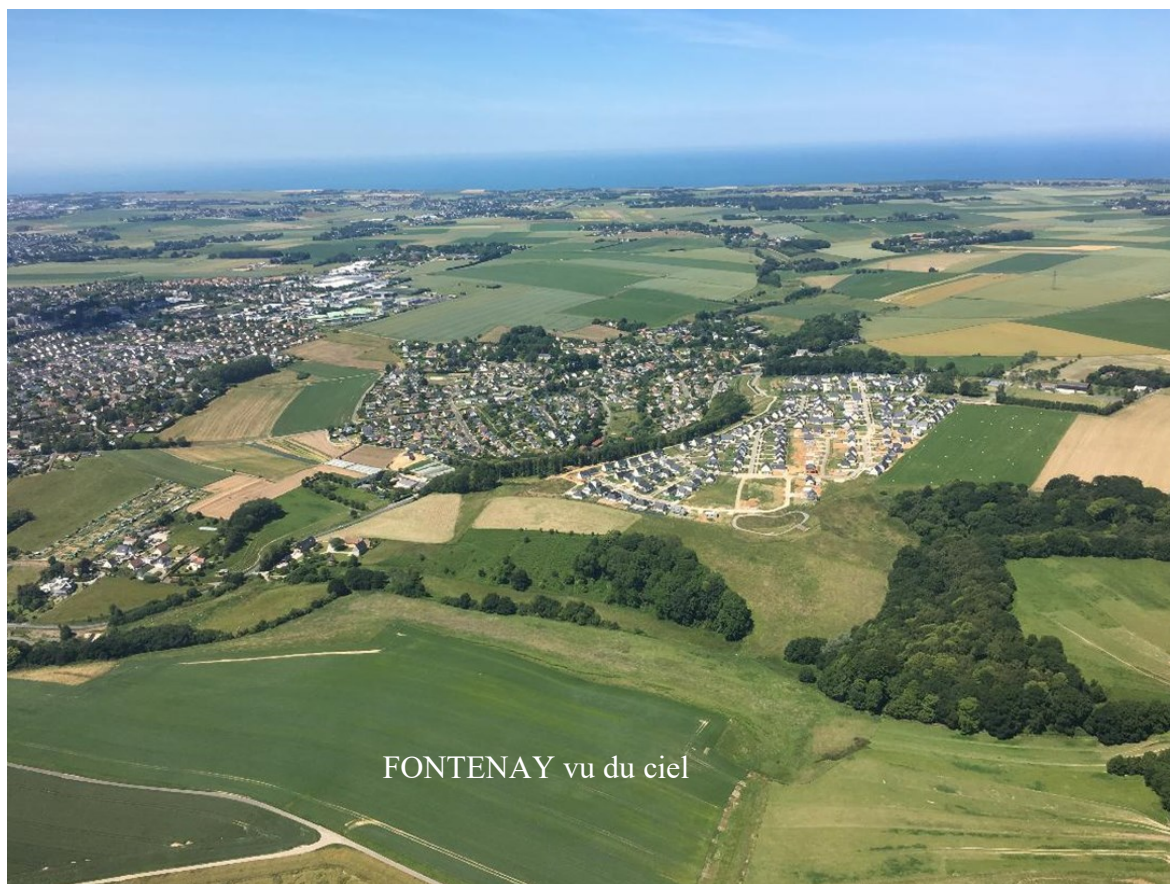
FONTENAY vu du ciel